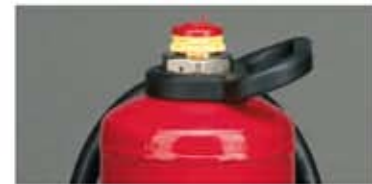
Abb. 1 Wandhalter Abb. 2 Fußring Abb. 3 Ventilamatur mit Tragegriff und Schlagknopf